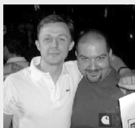
Corrado Lezza con Martin Solveig

«L'unica differenza che ho notato è la quantità di serate a tema. Ibiza sicuramente