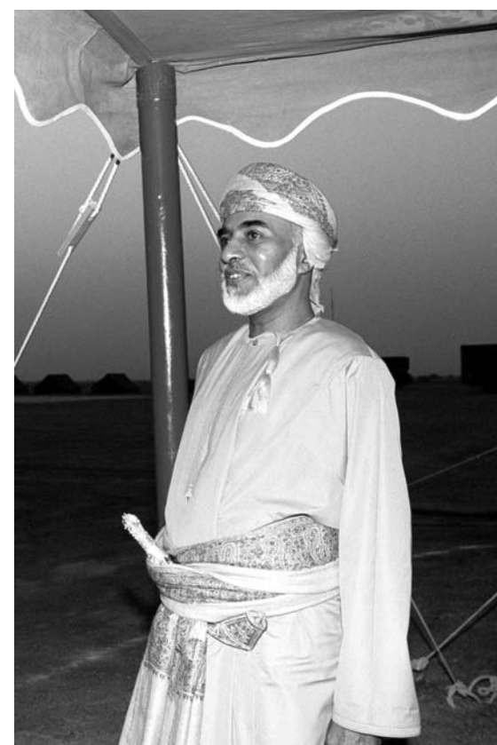
Nella foto qui affianco, il primo ministro dell'Oman; sotto e nella foto al centro, il sultano Qaboos bin Saïd; in alto nella pagina, lo yacht dove si terrà la cena di gala e una visita di alti dignitari di corte nella Basilica di San Nicola

sarebbe una leggenda metropolitana) che si è impegnata a farli arrivare ogni mattina al panfilo reale. Sembra che Qaboos Bin Saïd abbia l'abitudine di controllarne personalmente la intensità del profumo. Ora, l'altro giorno, il sultano, insoddisfatto della prova-olfatto, avrebbe respinto la fornitura al mittente e avrebbe cambiato immediatamente fornitore. L'altro dettaglio gustoso di «radiofante» riguarda la banchina del porto, inavvicinabile ai comuni mortali, in questi giorni. Lo staff reale avrebbe chiesto e ottenuto il posizionamento di una moquette speciale, tale da assorbire eventuali urti che possano danneggiare lo scafo del panfilo. Del resto, le tasse portuali sono state pagate con largo anticipo.